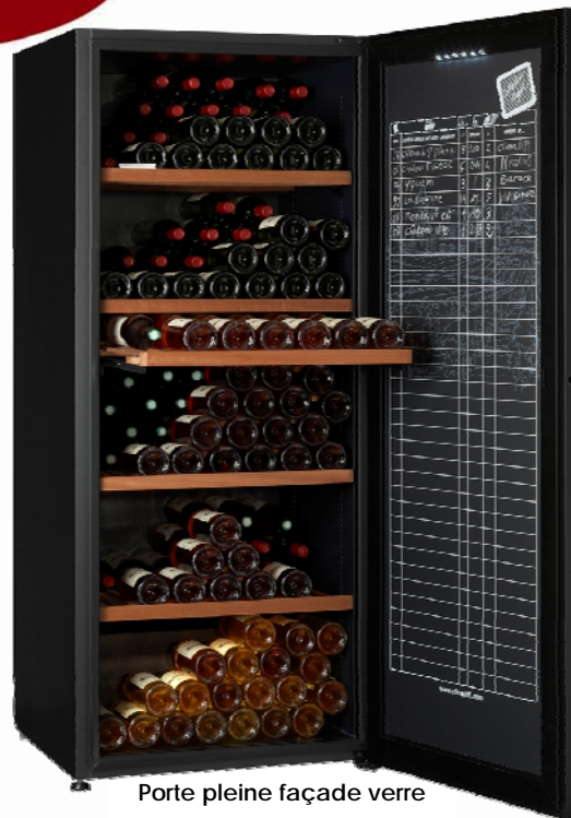
Porte pleine façade verre