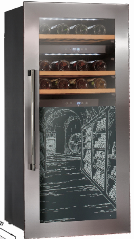
Version équipée du registre occultant (optionnel)

220-240V 50Hz - 1.2 Amp - Power Input 100 W 240 Kwh/an