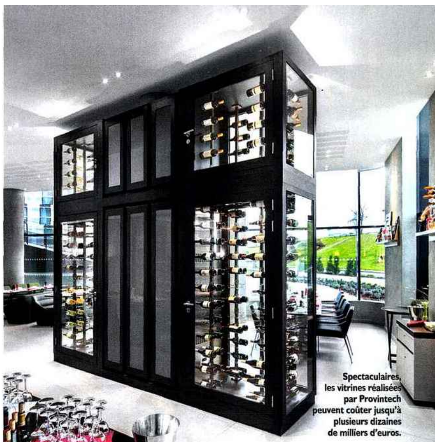
Spectaculaires, les vitrines réalisées par Provintech peuvent coûter jusqu'à plusieurs dizaines de milliers d'euros.