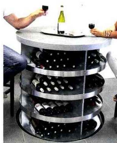
Polycave a imaginé une cave bar qui sort du sol, dans laquelle on peut loger près de 850 bouteilles.

Une dernière remarque à méditer : toute vitrine ou armoire à porte vitrée remplie de flacons dans une maison attire l'œil et attisera la soif de vos visiteurs ! ●